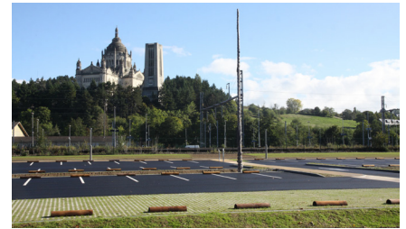
Ouverture du parking Lisieux-Normandie

Ce parking est écologique : une innovation qui porte tant sur sa réalisation que sur son fonctionnement (évacuation des eaux pluviales, bornes de recharge pour les véhicules électriques). Il sera