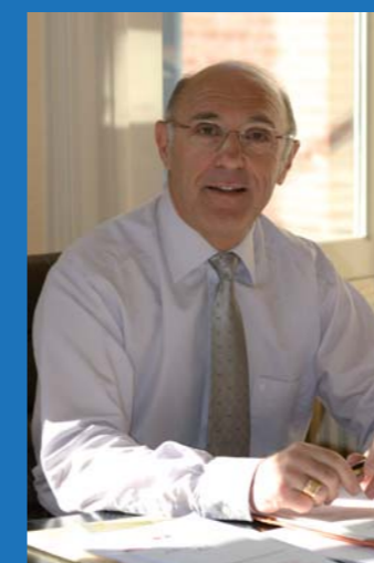
Bernard AUBRIL Maire de la Ville de Lisieux

LA LETTRE DU MAIRE Publication de la Ville de Lisieux Hôtel de Ville 21 rue Henry Chéron B.P.87222 14107 Lisieux Cedex Tél. : 02 31 48 40 40 Fax : 02 31 48 40 41