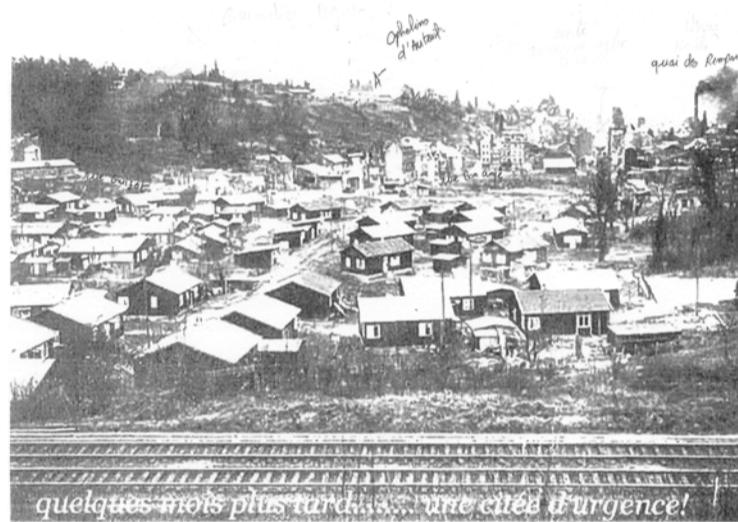
quelques mois plus tard... une cité d'urgence!