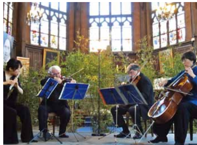
Hommage aux musiciens impressionnistes