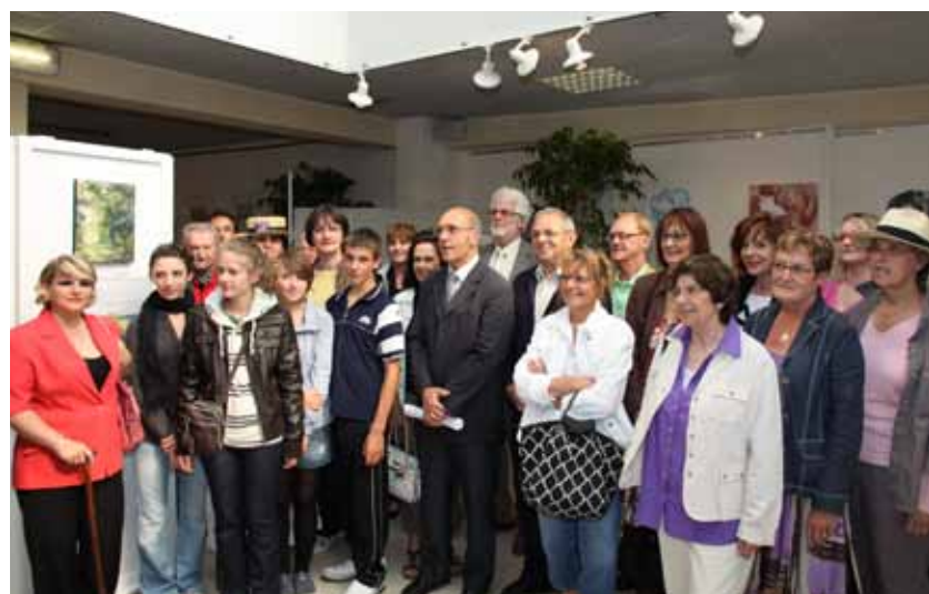
Exposition des ateliers d'arts plastiques