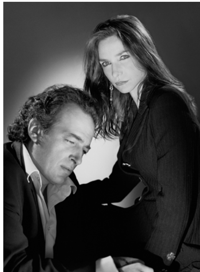
Concert « Robert et Clara »