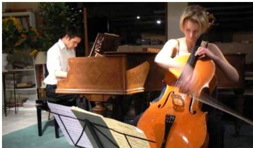
Concert « Au bord de l'eau »