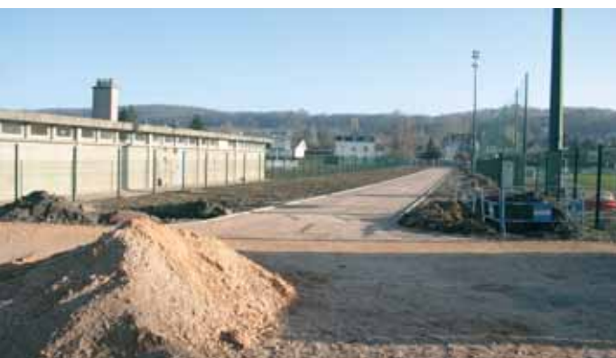
Création d'une allée piétonne traversant le Stade Bielman pour rejoindre la future salle multi-activités et le Groupe scolaire Paul Doumer. Cette voie est destinée à désenclaver et à relier les quartiers et comprend la création de 2 aires en enrobés, le traitement de l'allée en stabilisé, la plantation de haies arbustives comprenant 3 types d'essences différentes.