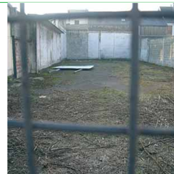
Rue Roger Aini et Rue Alexandre PIEL : aménagement de parkings.