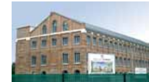
Une ville qui bouge Des réalisations structurantes