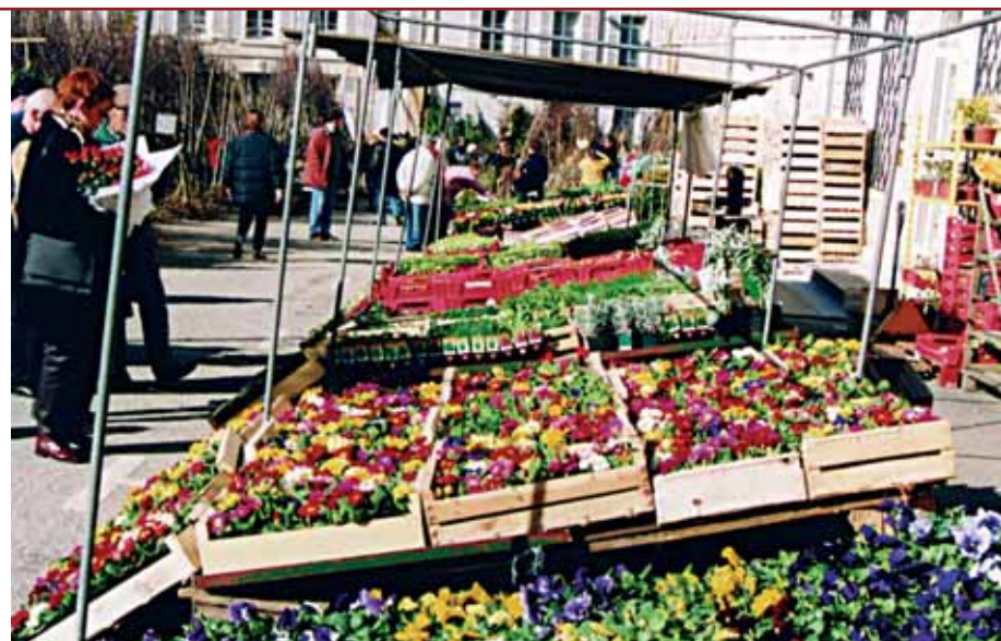
Un partenariat Ville de Lisieux - Communauté de Communes Lisieux Pays d'Auge

Remerciements à tous ceux qui ont participé à l'élaboration de ce numéro.