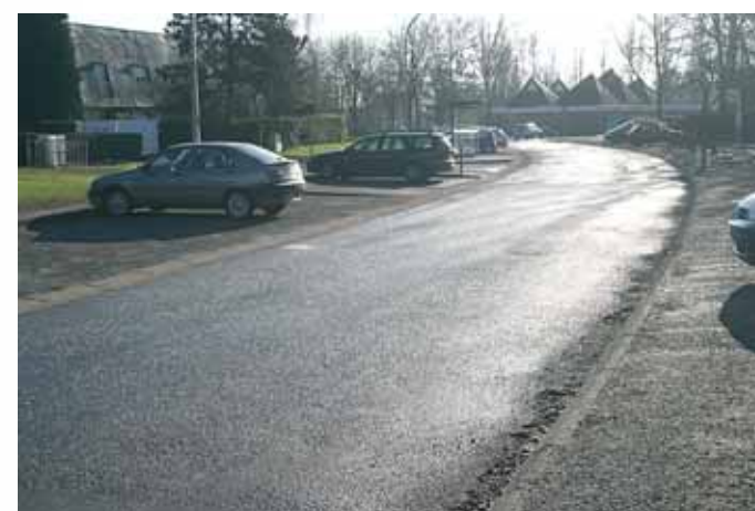
Rue Guillaume Le Conquérant Restructuration de la voie, décapage, aménagement d'un accès pour personnes handicapées réglementaire, aménagement de l'accès des entrées de maisons, installation d'un éclairage public devant l'entrée de l'Ecole Saint-Exupéry.