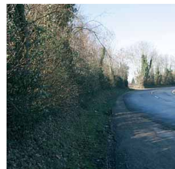
Chemin de la Tillhaye Création d'un éclairage public et d'un chemin piétonnier longeant la voirie, et peinture de la chaussée pour signaler le parcours sportif.