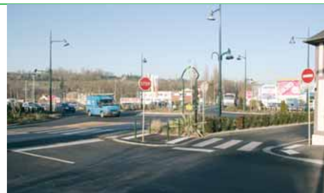
Réalisation d'un rond-point, rue Fournet , porte de Livarot, près d'Intermarché, pour assurer une meilleure sécurité et la fluidité de la circulation (un investissement de 550 000 €) : travaux finis.