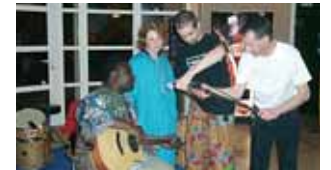
Foyer des jeunes travailleurs 10 e anniversaire