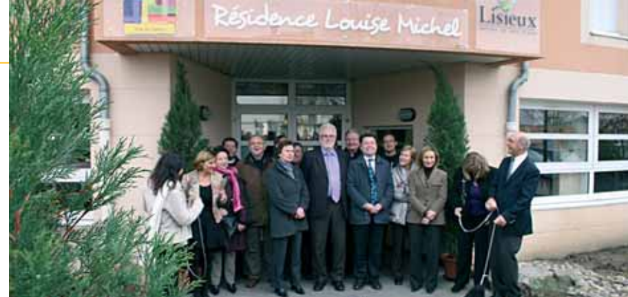
A l'occasion de l'inauguration par le Maire, tout un week-end d'exposition, de concerts et d'animations a été proposé aux visiteurs.