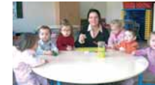
Maison de la Petite Enfance Projet 2009