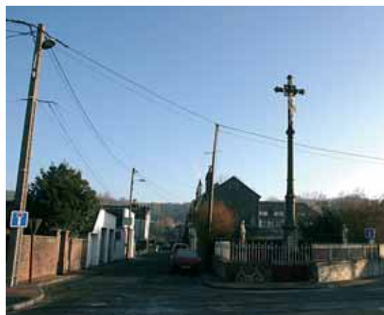
Allée du Petit Bon Dieu Effacement des réseaux de distribution d'électricité, d'éclairage public et de télécommunications