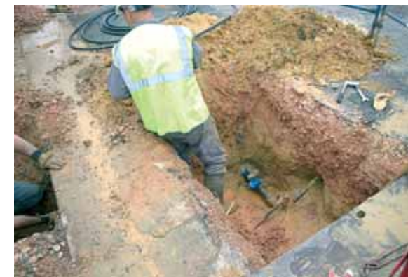
Rue Pierre Curie : reprise de toutes les canalisations

À la suite de nombreuses plaintes des riverains à propos de la vitesse excessive des véhicules empruntant cette route, la municipalité a mis en oeuvre des travaux pour réduire la vitesse des véhicules (création d'îlots centraux, diminution de la largeur de la route, création et réfection des trottoirs).