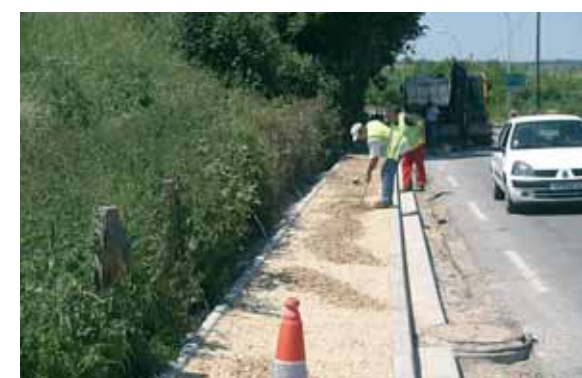
Rue d'Orival prolongée