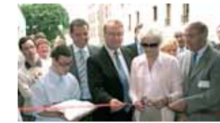
Nouvelle résidence pour les personnes handicapées