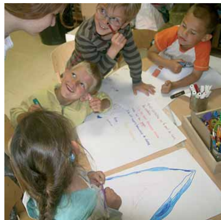
Centre de loisirs « La Vallée »

Le Centre de loisirs « La Vallée » fonctionne à 100 %. Ses cinq animateurs et ses 4 vacataires pour l'été, reçoivent en moyenne 65 enfants (de trois ans et demi à douze ans) par jour. Dans ces locaux donnant sur un jardin, on offre aux enfants de nombreuses animations allant des projets scientifiques et culturels, en passant par le yoga, les jeux, les contes et la menuiserie.