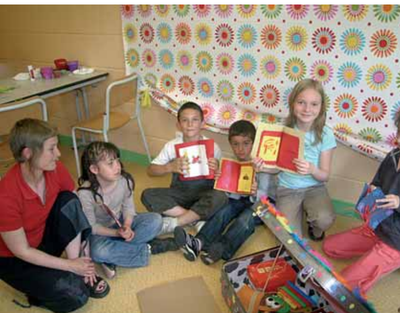
La Maion de quartier Trevett