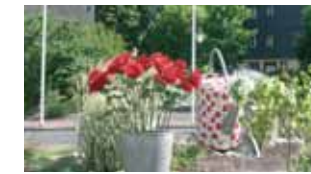
Au fil des ronds-points La couture