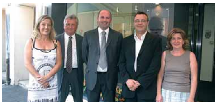
Une équipe à votre service

Le mercredi 1 er juillet dernier les élus ont présenté la nouvelle façade du service municipal des pompes funèbres qui vient terminer l'ensemble des travaux réalisés autour de l'Hôtel de Ville et dans la rue Au Char. Cette rénovation allie esthétique et accessibilité notamment pour les personnes à mobilité réduite.