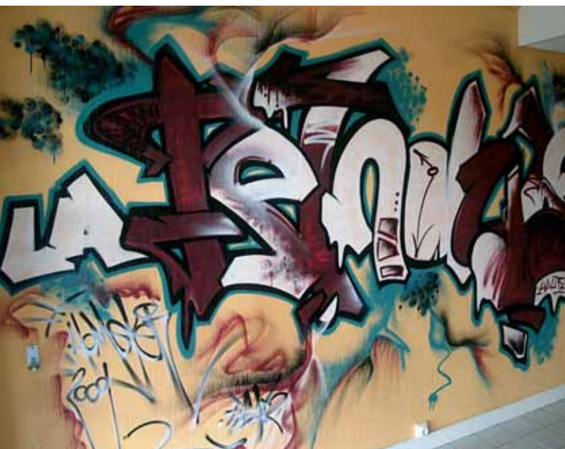
Local « la pendule »