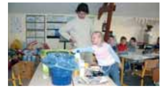
Ambassadeur du tri Vers une prise de conscience écologique