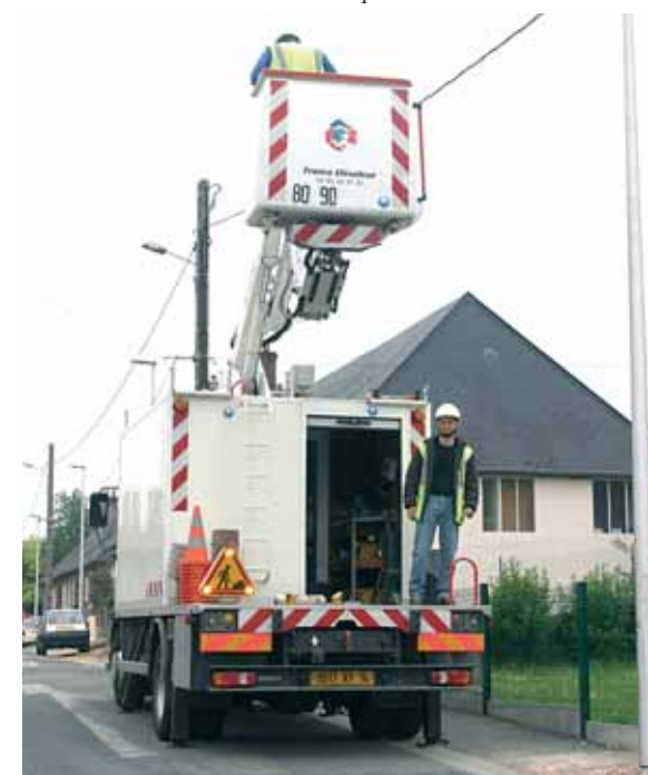
Rue Pierre Curie : effacement des réseaux