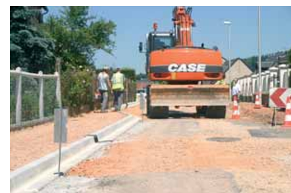
Rue Pierre Curie : création de trottoirs