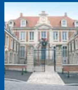
LE CONSEIL MUNICIPAL S'ENGAGE

LA LETTRE du Maire Publication de la Ville de Lisieux Hôtel de Ville 21 rue Henry Chéron BP 87222 14107 Lisieux Cedex Tél. : 02 31 48 40 40 Fax : 02 31 48 40 41 www.ville-lisieux.fr Directeur de la publication : Bernard Aubril Création : DBL Communication Impression : FO I Système Graphic Imprimé à 13 000 ex Dépot légal en cours