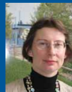
Clotilde VALTER Conseillère générale du Calvados