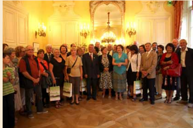
Mercredi 4 août, accueil d'une délégation québécoise dans le cadre du Comité d'Echange.