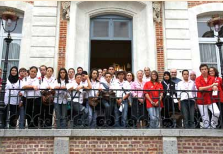
Lundi 2 août, réception de 24 scouts Tunisiens.